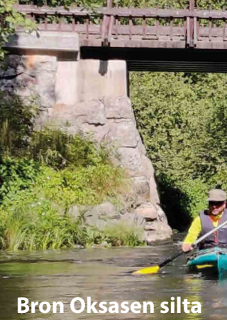
Bron Oksasen silta