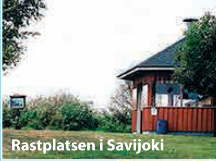
Rastplatsen i Savijoki