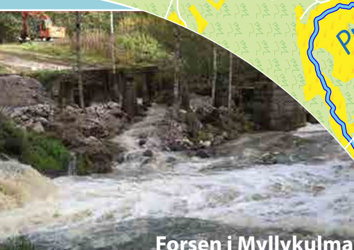
Forsen i Myllykulma