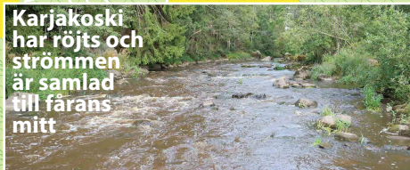
Karjakoski har röjts och strömmen är samlad till färans mitt

I Lahankoskiforsens övre del finns ett högt fall. Ta i land vid bryggan till höger före forsens. Omvägen går längs stigen förbi en gammal kvarnbyggnad (ca 250 m). Det lönar sig att reservera en liten stund för att beundra landskapen i Lahankoskiforsens omgivning.